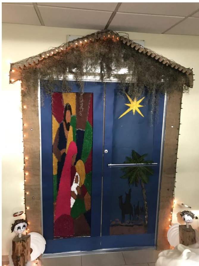
Puerta navideña 2018